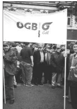
Eisenbahner auf der Studi-Demo

wäre es vorstellbar, dass der Teilnahme einer wichtigen Teilgewerkschaft an den Protesten von Studierenden nicht Rechnung getragen würde.