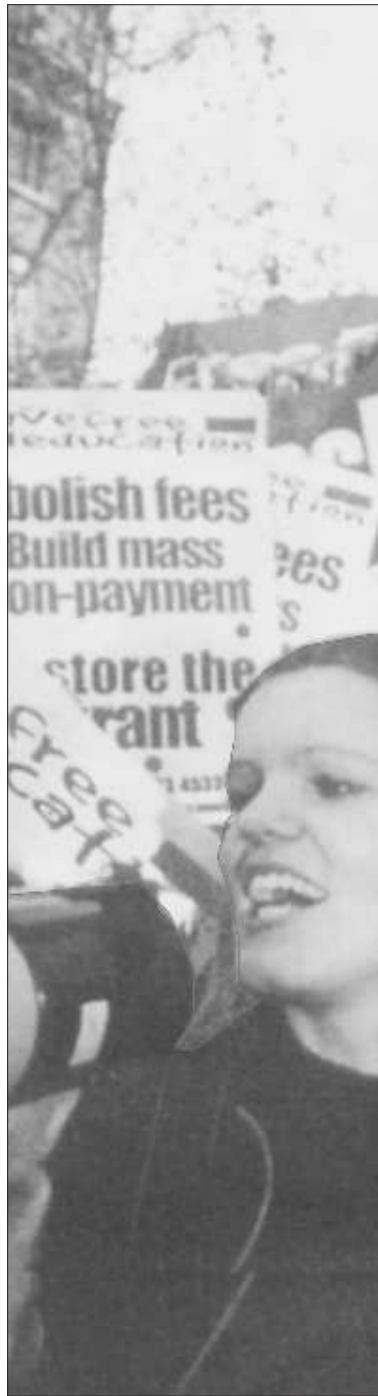
Studierendenproteste in Britannien gegen die Studiengebühren

Ohne Widerstand, der die Regierung am Nerv trifft, wird sie auch künftig immer einen reaktionären Minister gegen einen anderen austauschen. Zeigen wir ihnen und ihren prügeln Verbündeten auf der Straße, dass es anders geht, und tun