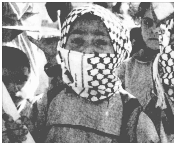
Kinder im Freiheitskampf

Seitdem geriet die PLO-Führung um Arafat unter wachsenden Druck von zwei Seiten. Von der "eigenen" Basis und der internationalen Diplomatie samt Israel. 1988 rief das Exilparlament einen unabhängigen palästinensischen Staat aus, 12 Jahre später steht es selbst um die 1993 vereinbarte "Teilautonomie" von Jericho und Gaza äußerst schlecht. Alle in den 90ern geschlossenen Verträge waren das Papier nicht wert, auf dem sie