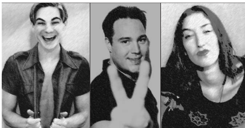
Das Model Chris, der schwule Robert und die aufmüpfige Andrea wollen eine Million verdienen und singen kritische Anti-Temelin-Lieder. Reality-Soap mit Bildungsauftrag

nach Brüssel und bin auch sonst im Büro voll integriert, aber die Entlohnung ist viel zu niedrig. Ich komme mir oft wahn-sinnig ohnmächtig vor. Ich muss diese unbefriedigende Arbeitssituation einfach hinnehmen. Ich darf mich nicht im Freundeskreis beklagen, um ja keinen Rauschmiß zu riskieren. Meine Zukunft ist ungewiss. Die Ungerechtigkeit möchte ich laut hinausschreien, aber ich darf es aus Vernunftgründen nicht, weil ich sonst selbst diese Arbeit verliere. Ich bin eine „freie Mitarbeiterin“, heißt es. Ich fühle mich aber nicht frei, sondern im Gegenteil ohnmächtig, abhängig und eingesperrt, unmündig und wehrlos". Das Zitat beweist, dass Betroffene durchaus etwas über ihre Situation zu sagen haben. Ihnen den nötigen Raum in der öffentlichen Debatte zu erkämpfen, wird