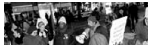
Flüchtlingsprotest auch in Linz