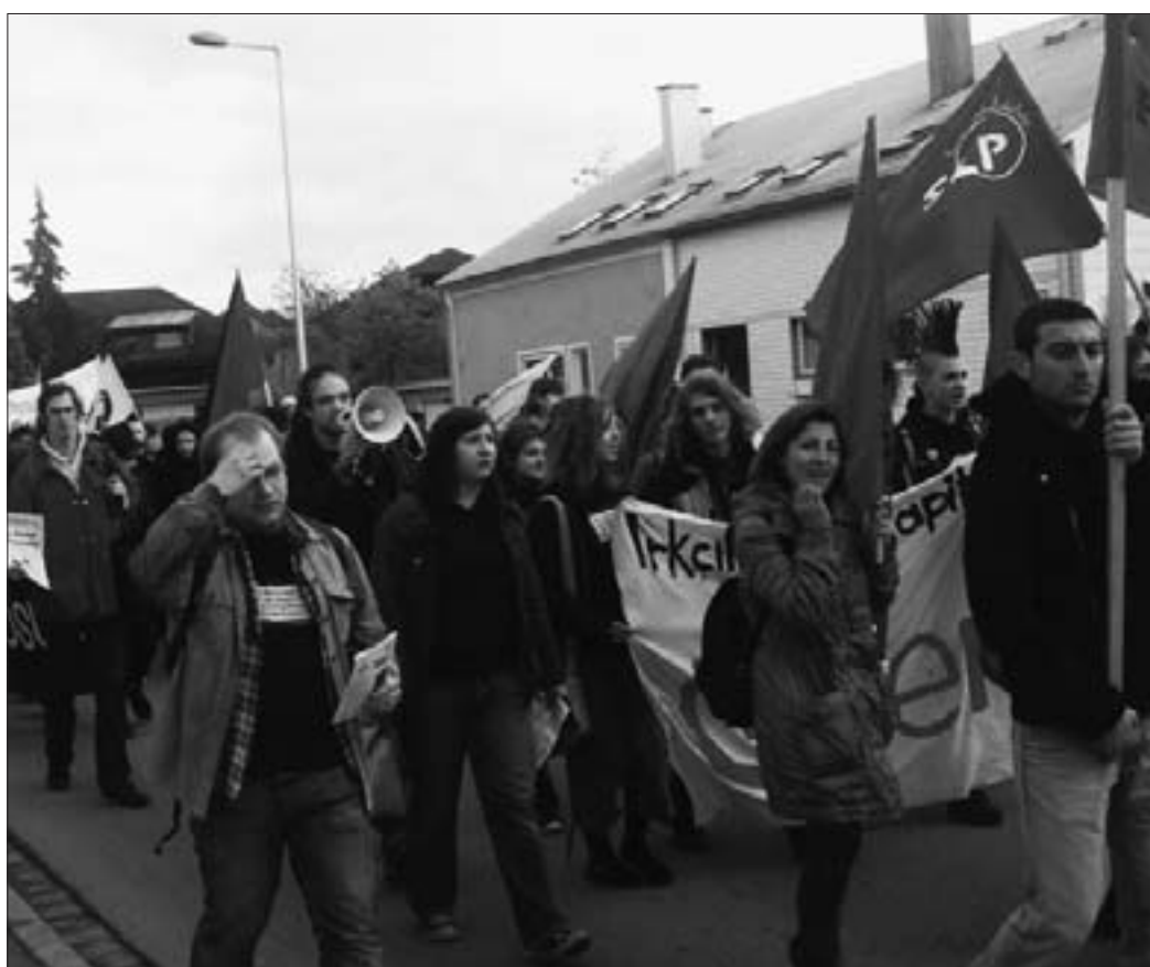
Block der Sozialistischen Linkspartei bei der Demonstration gegen Nazis in Braunau / OÖ am 19. April 2008

Ort: "Shakespeare", Salzburg, Hubert-Sattler-G. 3 (Mirabellplatz)