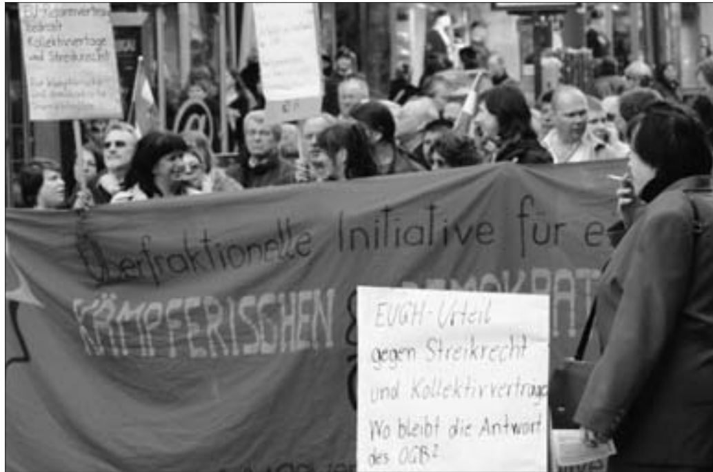
Kämpferische GewerkschafterInnen auf der Demonstration für eine Volksabstimmung über den EU-Vertrag in Wien

Nicht nur, dass das BZÖ in der Regierung für die EU-Verfassung gestimmt hat. Auch die tägliche Politik von FPÖ und BZÖ strafen ihre Propaganda gegen den Reformvertrag Lügen. Die Verpflichtung zur Aufrüstung und die Beteiligung an imperialistischen Kriegen ist nichts EU-Spezifisches. FPÖ und ÖVP haben gemeinsam die Eurofighter