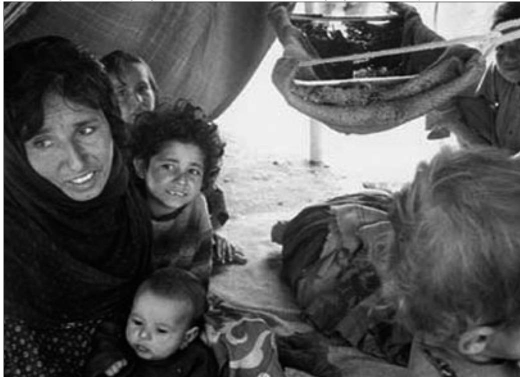
Flüchtlingslager in Pakistan

denn eine Diskrepanz von 200.000 kann man beim besten Willen nicht den verschiedenen Auslegungen von Statistiken anlasten. Ebenso gelogen ist natürlich die Behauptung der „unkontrollierten“ Zuwanderung: In den letzten 15 Jahren wurden die Ausländergesetze mehrmals verschärft - offensichtlich völlig sinnlose Maßnahmen wenn es wirklich „100.000 Illegale“ in Wien gibt. Wir meinen: Die einzig sinnvollen Maßnahmen gegen „Illegale“ sind volle soziale und politische Rechte für alle Menschen, die hier arbeiten und leben. Nur das verhindert Lohn- und illegale Beschäftigung und Kriminalität.