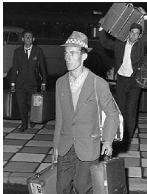
Ankommende Gastarbeiter in den 1960ern. (Deutschland)

Menschen, die von einem Staat in den anderen wandern, sind leicht zu erpressen, weil ihr Aufenthalt potenziell jederzeit von staatlicher Seite beendet werden kann. Fundamentale Rechte demokratischer und sozialer Natur werden ihnen abgesprochen. Ihr sozialer und rechtlicher Sonderstatus macht MigrantInnen für die Wirtschaft interessant. Sie können als besonders billige flexible Arbeitskräfte eingesetzt werden und erfüllen damit die Funktion einer Reservearmee. Typisch trat dieses Muster in Österreich am Phänomen der Gastarbeit zutage. Der Mangel an Arbeitskräften - Ergebnis des Wirtschaftsaufschwungs und des Ausbaus von Bildungs- und Pensionssystem - drückte in Verbindung mit dem hohen gewerkschaftlichen Organisationsgrad die Profitraten. In dieser Situation sollte die gezielte Anwerbung von türkischen und jugoslawischen Arbeitskräften, vor allem für Hilfstätigkeiten, Abhilfe schaffen. Ab 1965 wurden über eigene Anwerbestellen in den jeweiligen Ländern zehntausende ArbeiterInnen rekrutiert. In Österreich erwarteten sie miserable Löhne, schlechte Unterkünfte und Rechtslosigkeit.