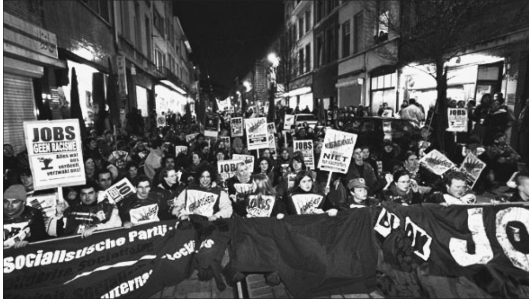
Demonstration unserer belgischen Schwesterpartei unter dem Motto: "Jobs - Nicht Rassismus!"

Wir wiesen auf die ausweglose Situation vieler Asylsuchenden und auf das überfüllte Lager hin. Die Menschen in Traiskirchen werden von