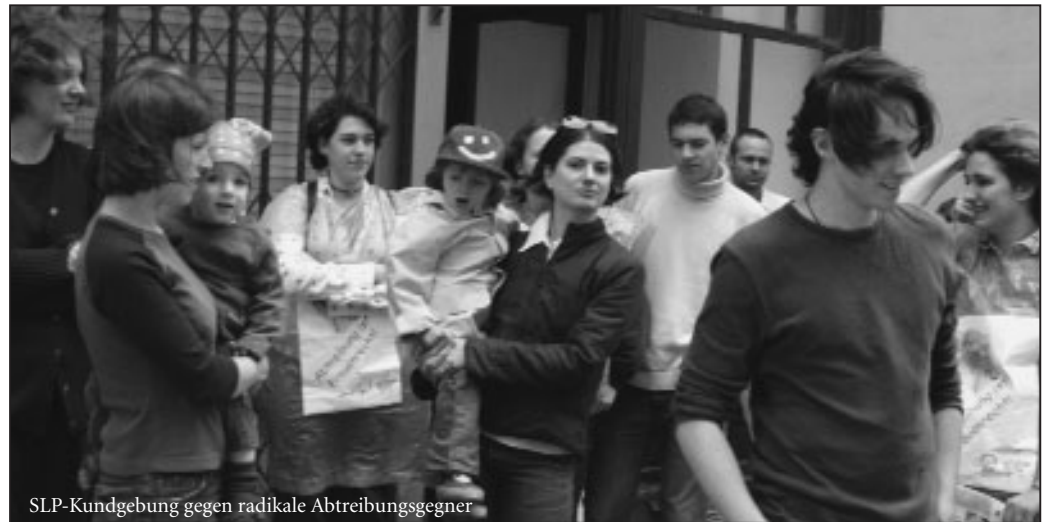
SLP-Kundgebung gegen radikale Abtreibungsgegner

Die SLP führte von Anfang 2001 bis Mitte 2004 eine Kampagne zur Verteidigung der Lucina-Klinik. Diese Klinik war in besonderem Ausmaß vom HLI-Terror betroffen und musste letztlich zusperren. Die SPÖ-Frauen wurden regelmäßig über die Zustände rund um die Klinik aufmerksam gemacht. Es gab seitens der SPÖ weder Artikel in der Bezirkszeitung noch eine Beteiligung an Kundgebungen. Nichts geschehen